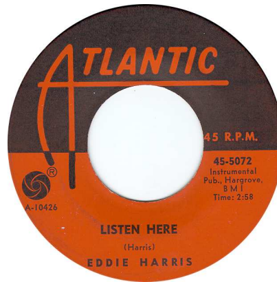
US Single: Listen Here (A-10426 / 45-5072)

Offensichtlich versucht Eddie Harris seine ehrfurchtgebietende Talentvielfältigkeit zu zeigen, um die breitmöglichste Zuhörerschaft anzusprechen. Harris sagt im folgenden Statment: “Ich möchte ein Musiker da draussen sein, ich möchte nicht bewertet werden an nur einem Stück.“