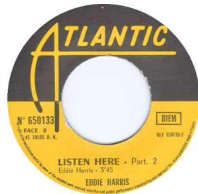
Französische Single: Listen Here part1 & part2 (No 650133 / BLY 650133-1 / 2)