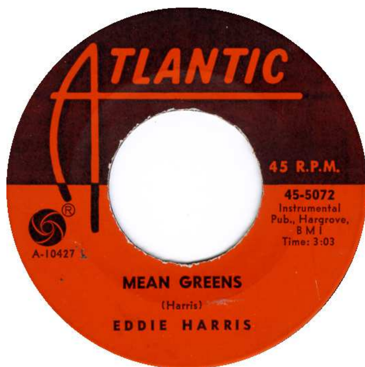
Singel: Mean Greens (A-10427 / 45-5072)

Seine Beherrschung des Tenor-Saxophon ist auf einige Musiker zurückzuführen. Seine Leichtigkeit ist das Resultat von mehr als fünfzehn Jahren harter, ständiger Arbeit. Sogar jetzt behält er seinen Stundenplan konsequent bei, übt sieben bis acht Stunden täglich.